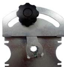
CLE DE COMMANDE