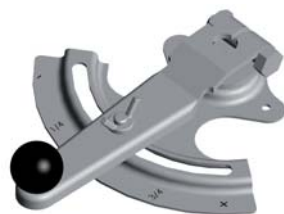
CLE DE COMMANDE