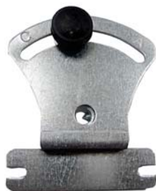
CLE DE COMMANDE